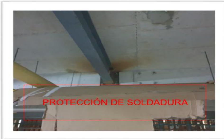
Protección de tuberías para evitar daños por soldadura