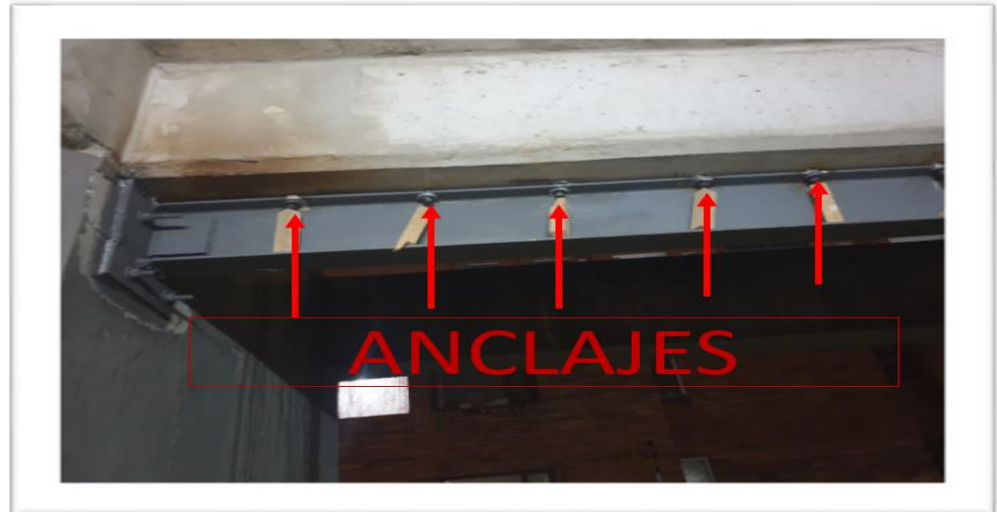
Instalación de anclajes en elemento horizontal de la torre 4

Las labores de reforzamiento se ejecutaron conforme a lo indicado en los planos y considerando la prioridad dada por etapas según la empresa que realizó los estudios y presentó el diseño GEOESTRUCTURAS SAS