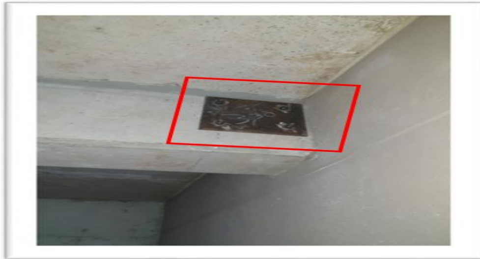
Anclaje de platinas